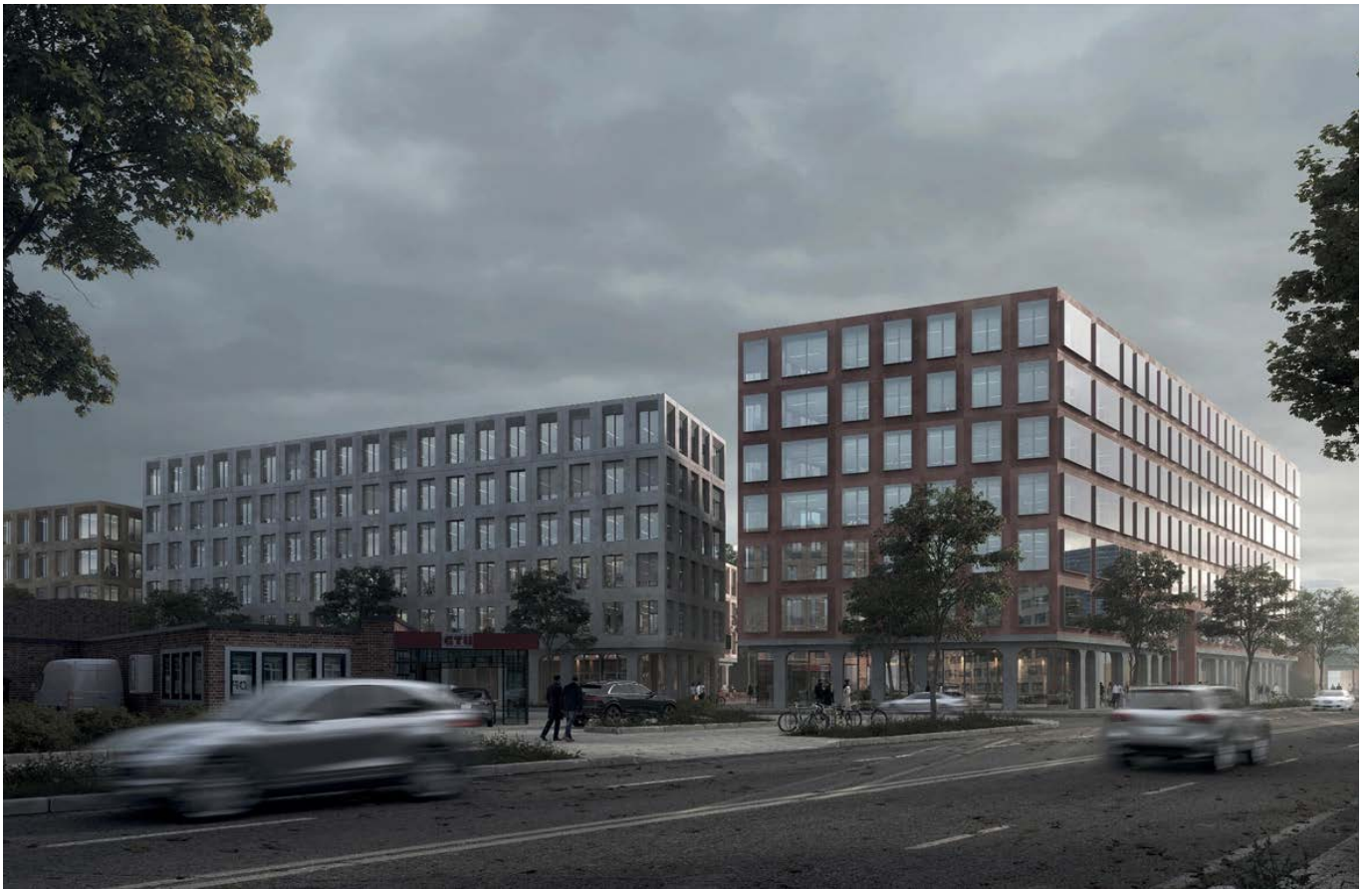
Blick von der Eiffestraße auf das Ensemble / view from Eiffestraße