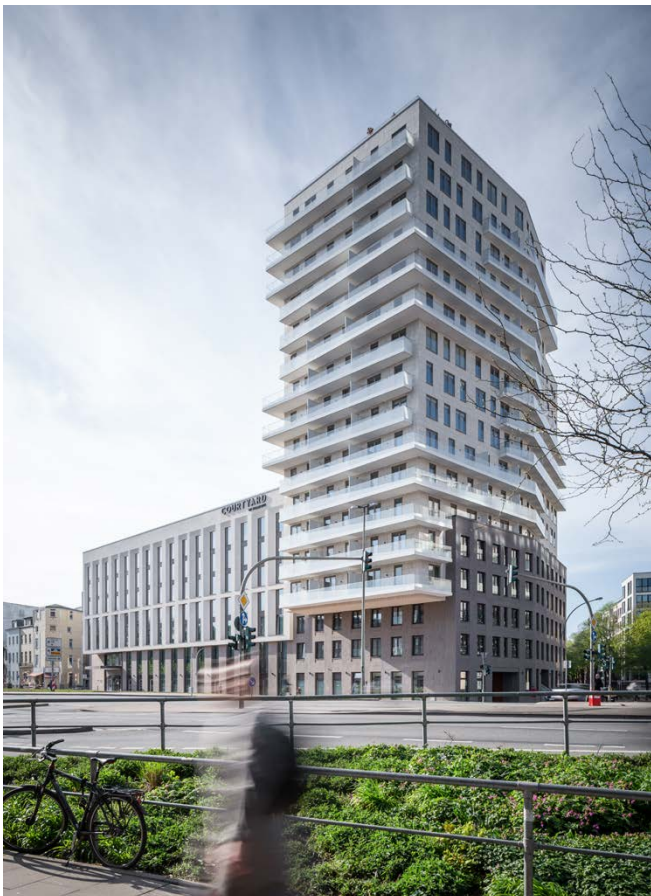
Blick auf den Wohnturm / residential tower view

The „Konrad“ residential project is located on Hamburg's Adenauerallee, a main traffic axis leading from the city centre to the Berliner Tor. The street is characterised by up to 90 metre high building blocks, while the adjoining development of the district is markedly lower. The project comprises a 55 metre high residential tower with 113 residential units on 17 floors and a 4-star hotel with 277 rooms in a seven-storey block. The structures of building heights and dimensions on the site create a harmonious transition and close the gap between Lindenstrasse and Böckmannstrasse.