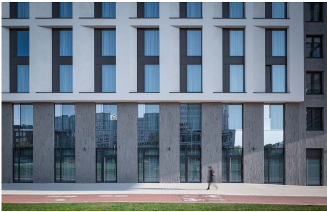
Blick auf das Hotel / hotel view