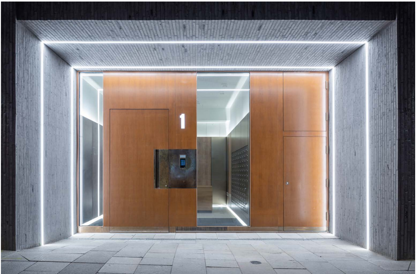
Blick in die Lobby des Wohnturms / view into the lobby of the residential tower

The residential tower with its façade of light-coloured ceramic and travertine cladding and balconies with printed glass balustrades is a landmark visible from afar. Special box windows with sun protection integrated in the space between the panes take into account the high sound insulation requirements. The upper floors offer views of both the Alster and the Elbe.