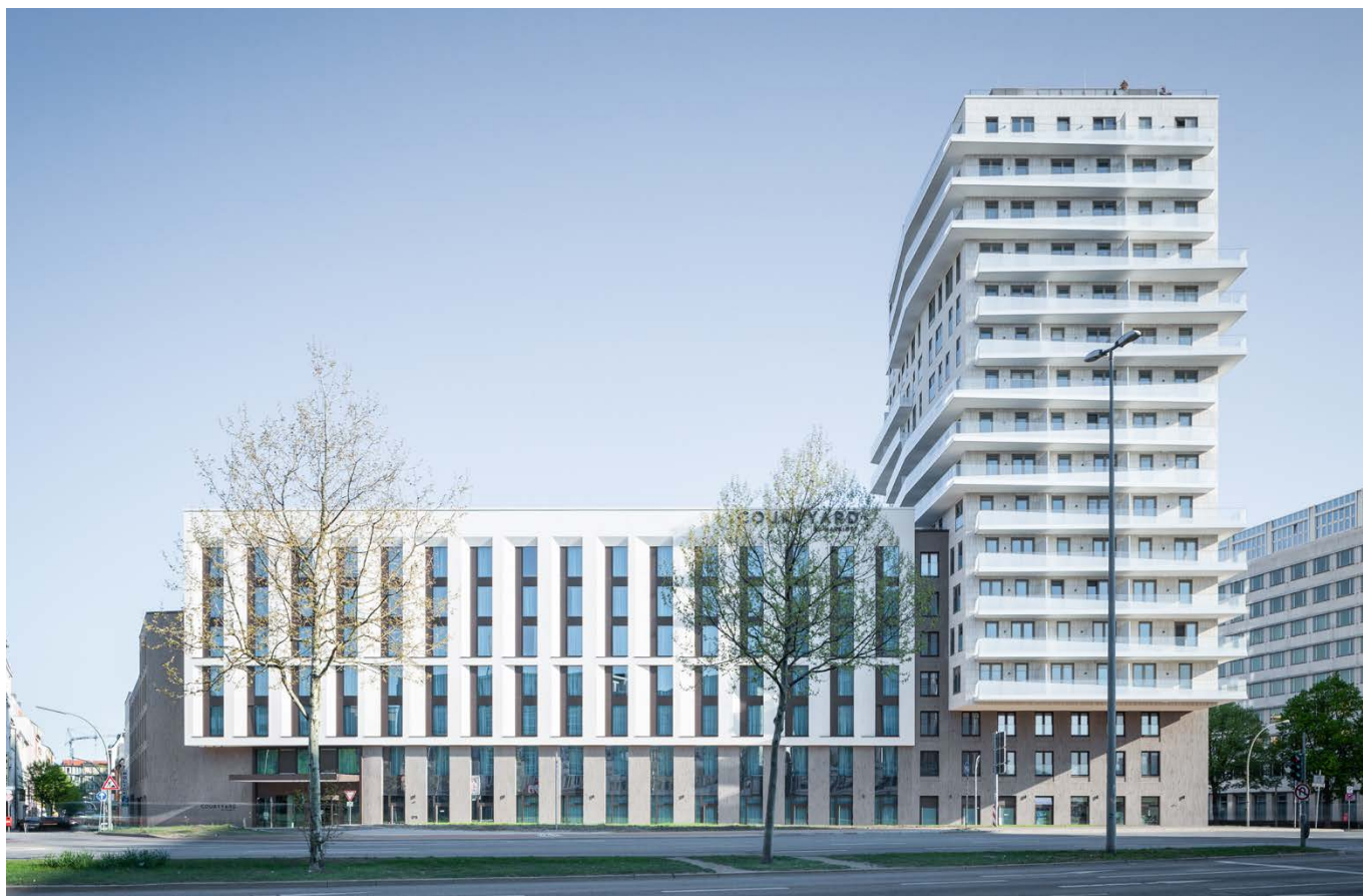
Blick von der Adenauerallee / view from Adenauerallee