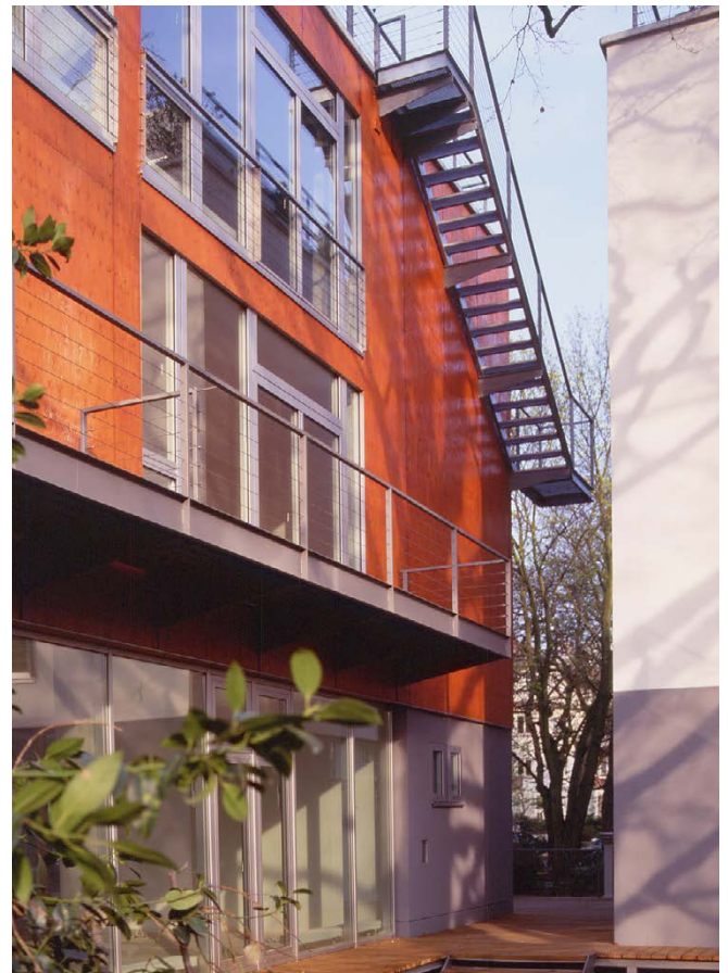
EG mit Holzsteg / Ground floor with wooden walkway