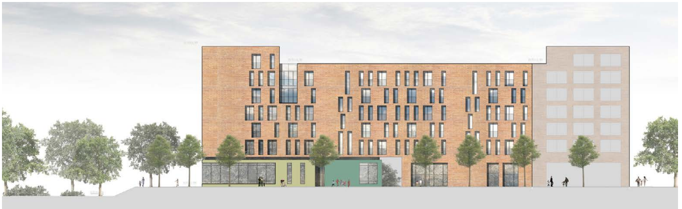
Ansicht Lohsepark / elevation Lohsepark