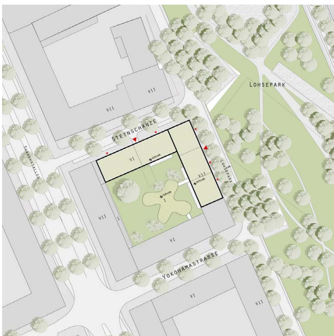
Lageplan / site plan

A new, multifaceted residential quarter is being developed at Lohsepark, the central district park in the HafenCity. Construction site B comprises 66 residential units, 15 of which are WK-subsidised apartments. Our design reacts to both the different qualities of the urban context and the orientation of the living spaces. The building is divided into a differentiated plinth zone and the residential floors above. Towards the public space and the courtyard, the appearance of the upper floors is characterised by two contrasting façade typologies – a glass façade structured by sculptural frame elements with recessed loggias and a perforated façade characterised by the material used. A solid brick façade is planned on the side of Lohsepark and along the „Steinschanze“, while the inner courtyard sides is finished with an ETICS façade.