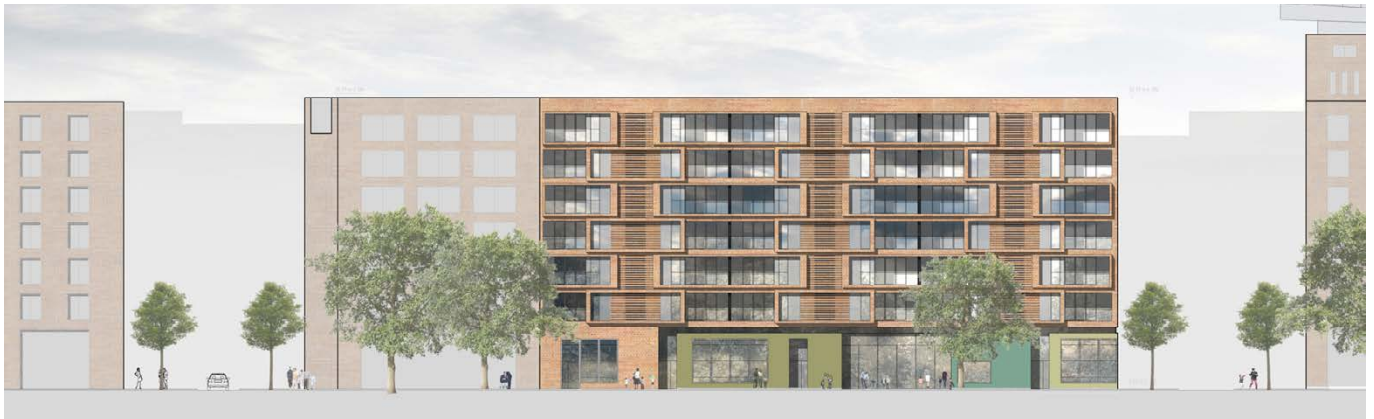
Ansicht Steinschanze / elevation Steinschanze

Die nach Süden ausgerichteten Wohnungen sind mit großzügigen Loggias geplant, die Wohnungen des östlichen Flügels verfügen zusätzlich über Balkone zur Westseite am Hof. Alle Wohnungen sind so angeordnet, dass reine Erschließungsflure innerhalb der Wohnungen auf ein Minimum reduziert sind und fließende Raumübergänge, insbesondere in den Wohn- und Kochbereichen, gegeben sind.