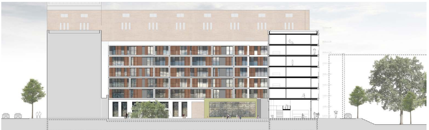
Schnitt, Ansicht Süd / section, south elevation

The south-facing apartments feature spacious loggias, while the apartments in the eastern section have additional balconies facing the courtyard. All apartments are laid out so that pure circulation corridors inside the apartments are reduced to a minimum and flowing space transitions are ensured, especially in the living and kitchen areas.