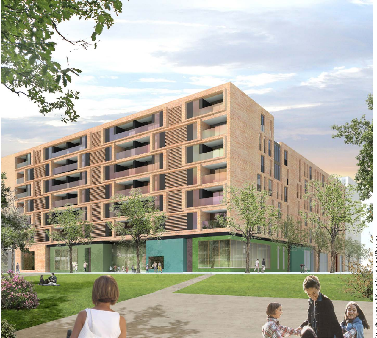
Visualisierungen: Störmer Murphy and Partners