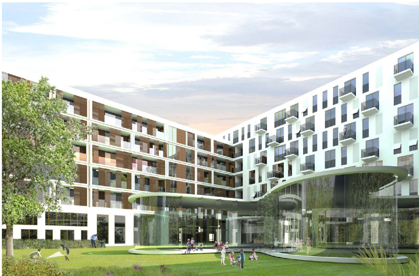
Blick auf die KiTa / view to the day-care centre