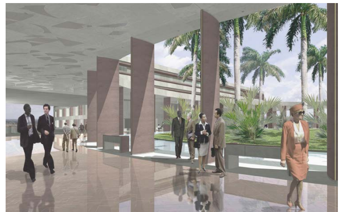
Visualisierung / visualisation