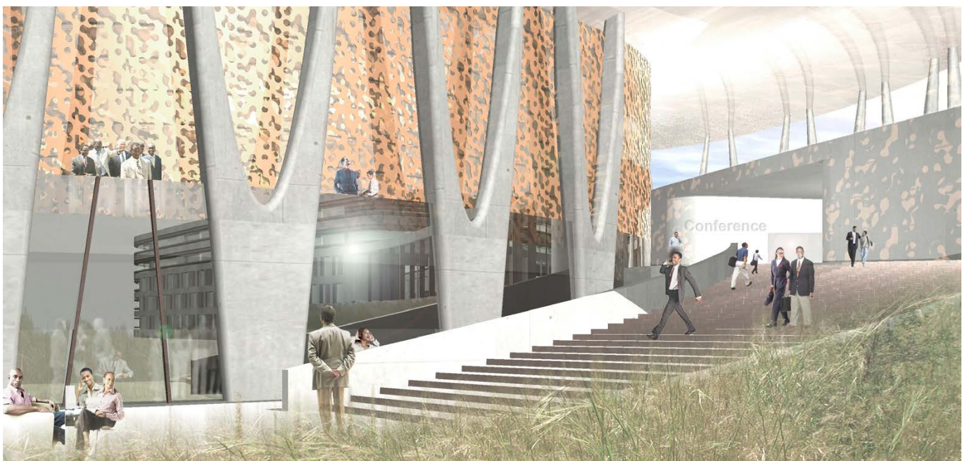
Visualisierung / visualisation

The building complex which sits in a beautiful, untouched landscape comprises a hotel with approximately 300 rooms, respectively suites for international state guests as well as a conference centre. The architectural vocabulary seeks a special response to the local landscape, materials, and climate. Intelligent systems that enable an independent operation need to be developed for the required infrastructure.