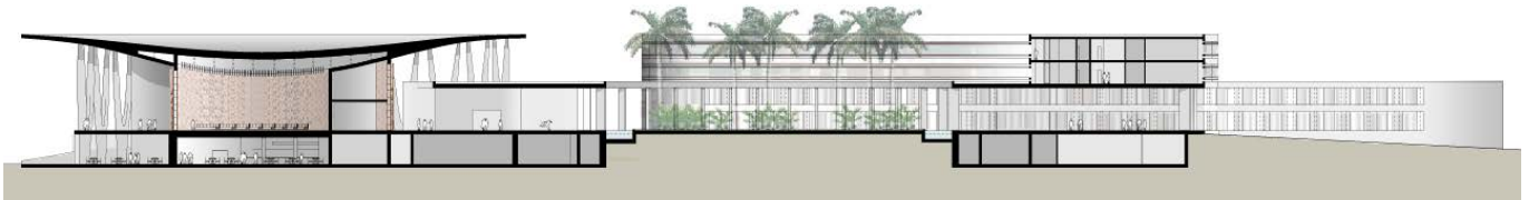
Schnitt / section