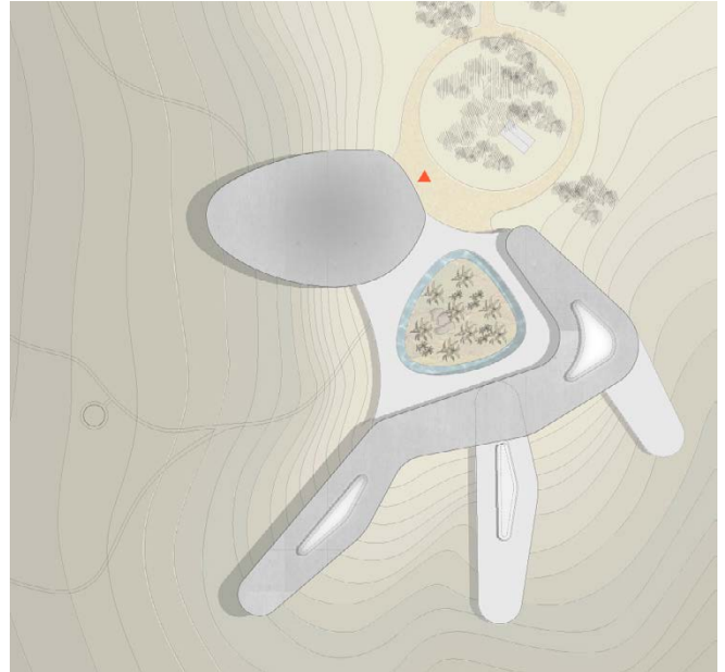
Lageplan / site plan