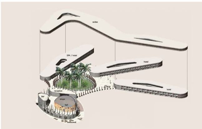
Axonometrie / axonometric view