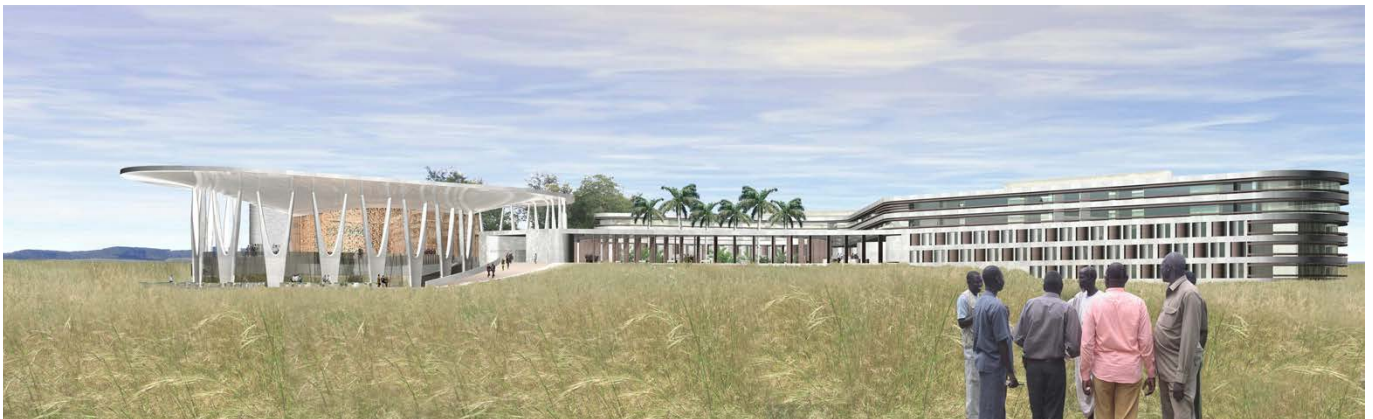
Ansicht West / western elevation

The peace treaty signed in January 2005 between the North and South of Sudan made it possible to massively advance the development of the southern part of the country. After years of war it was now necessary to initiate political, social, and economic reconstruction measures with international support in order to develop the country's infrastructure quickly and purposefully. The first important construction project to be planned was a „State House“ in Nimule near the border to Uganda. Another civil war ended the plans for the State House.