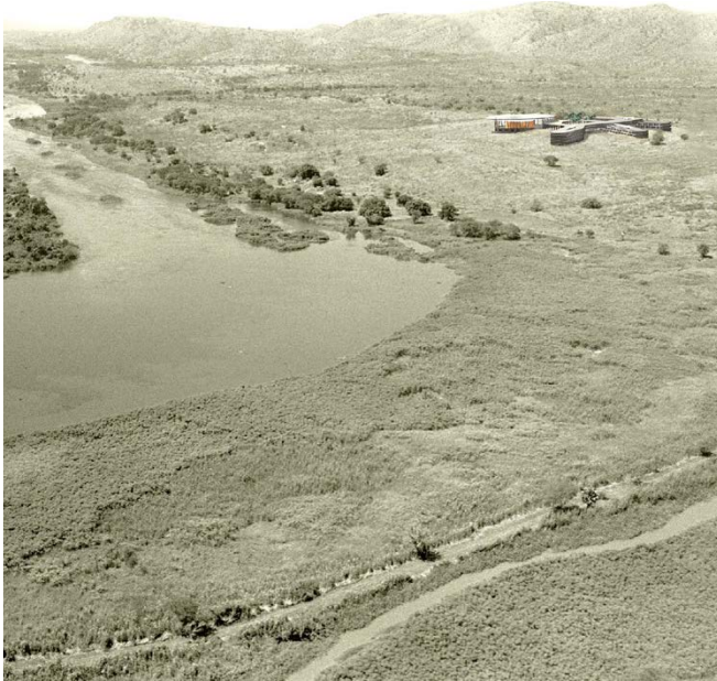
Blick in die Landschaft / view into the landscape