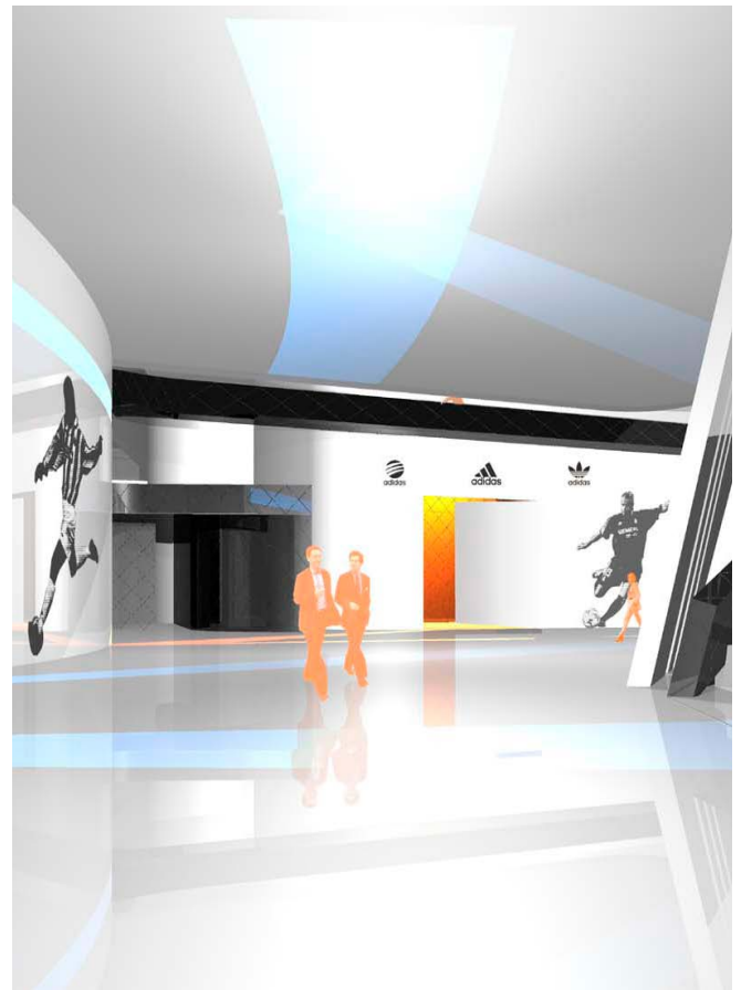
Visualisierung / visualization