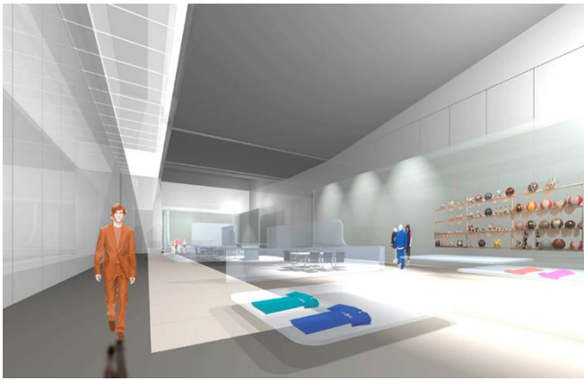
Innenraumperspektive / internal erspective

Das Gebäude stimmt den Besucher auf die Welt der Adidas-Produkte ein und dient gleichzeitig als äußerst flexible und funktionale Ausstellungshalle. Der schwarze Solitärbau erhält eine gläserne Haut, die von feinen, weißen Streifen gegliedert wird. Er steht in einer üppigen Landschaft, umgeben von Bäumen und Freiflächen, die sich in den reflektierenden Fassade widerspiegelt.