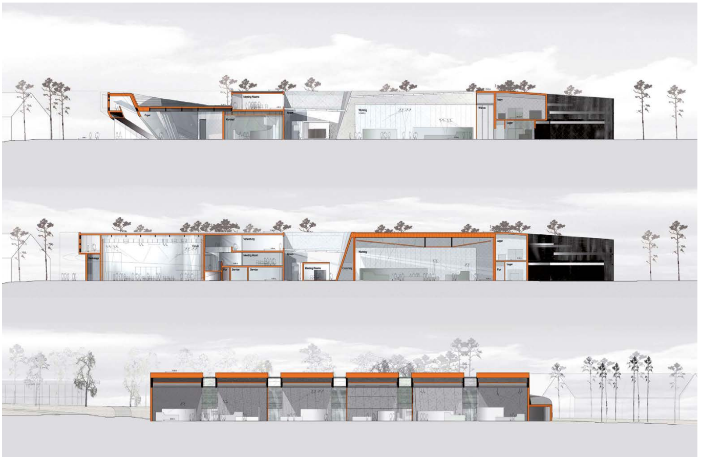
Geländeschnitte / site sections

The building attunes the visitors to the world of Adidas products, whilst simultaneously being a highly flexible and functional exhibition hall. The black solitaire is finished with a glass envelope, which is structured by fine, white stripes. It is positioned in a lush landscape, surrounded by trees and open spaces, which are reflected on the façade.