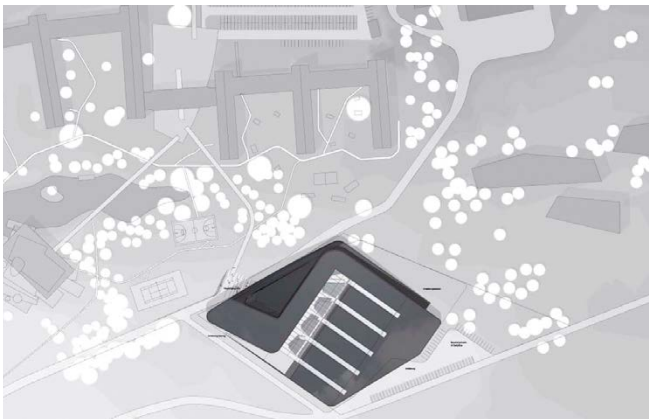
Lageplan / site plan

The Adi Dassler Brand Center at the headquarters of Adidas near Nuremberg provides space for events and exhibitions. The centre comprises an entry hall, a forum, „concept areas“ for three product ranges and „working areas“ with halls and conference rooms. The building concept is derived from the brand value as well as the appearance of the various adidas products. With its smooth shapes, dynamic curves, and reflective façades, the building harmoniously blends into the surrounding landscape.