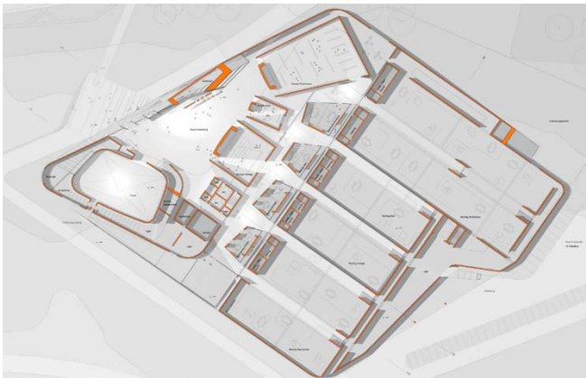
Grundriss / ground plan