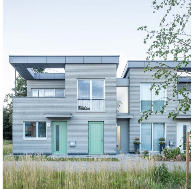
Wohnhäuser / apartment buildings