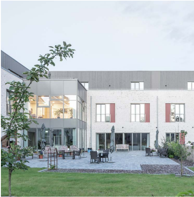
Seniorenpflegeheim / retirement home