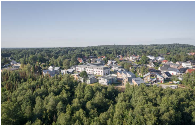
Gesamtperspektive / overall view

In Worswede, home to the most significant artists' colony in northern Germany, a new residential quarter has been developed. In cooperation with the local investor, we developed a contemporary settlement concept as an alternative to the usual, uniform estates on the suburban periphery. Modern architecture and an urban planning concept that promotes a social and solidarity-based neighbourhood community for all ages were important tasks, as well as high demands on climate and environmental protection for sustainable building and living.