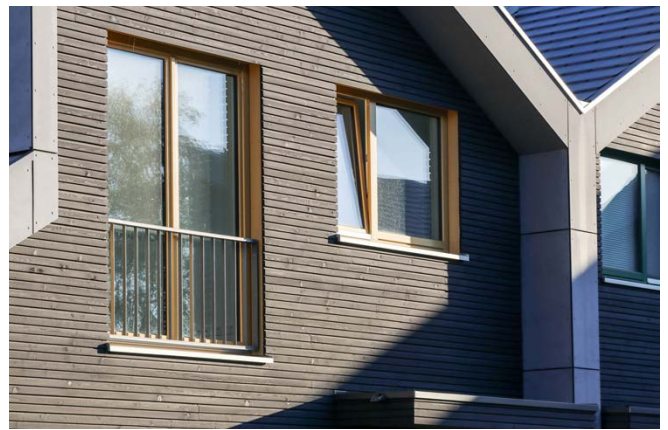
Detail Holzfassade / timber facade detail

Angeordnet in Hausgruppen um gemeinschaftlich genutzte Höfe herum entstanden 20 Doppelhäushälften, sechs Reihenhäuser und fünf Wohnhäuser mit je vier Wohnungen. In der Mitte der Grundstücks befinden sich ein Gemeinschaftszentrum mit einem Seniorenpflegeheim und eine Kindertagesstätte. Der gemeinsame Entwurfsgedanke der Siedlung – markante Shed- und Pultdächer und eine einheitliche Materialität mit sichtbaren Holzanteilen in der Fassade – verleiht ihr ein ebenso homogenes wie unverwechselbares, identitätsgebendes Gestaltungsbild. Die Reihen- und Doppelhäuser sind in baubiologisch geprüfter Holzbauweise mit KfW 55 Standard geplant, wurden kostengünstig vorgefertigt und innerhalb weniger Tage aufgestellt.