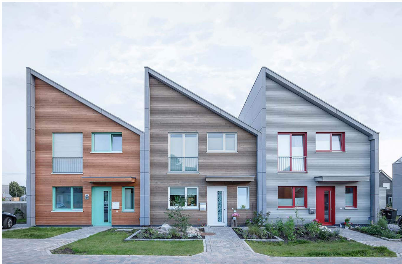
Reihenhäuser / terraced houses