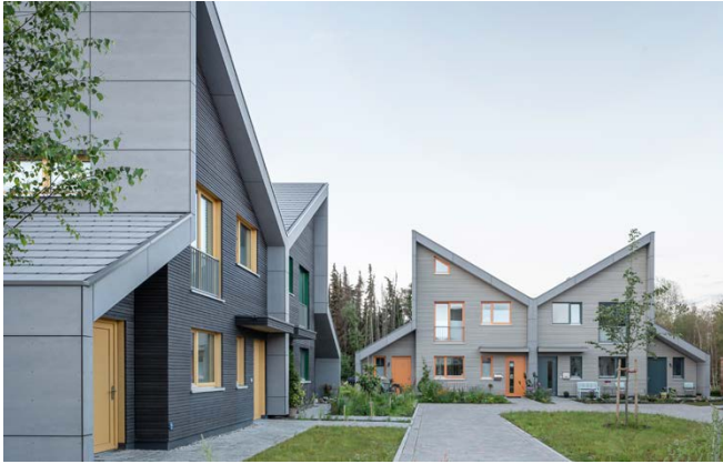
Gemeinschaftlich genutzter Hof / communal courtyard