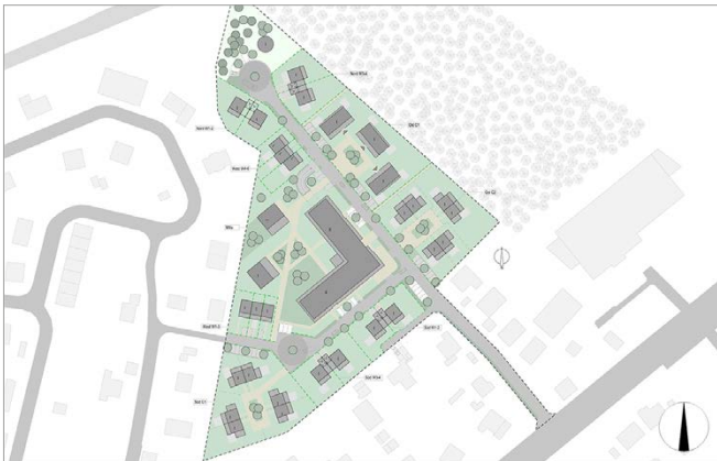
Lageplan / site plan