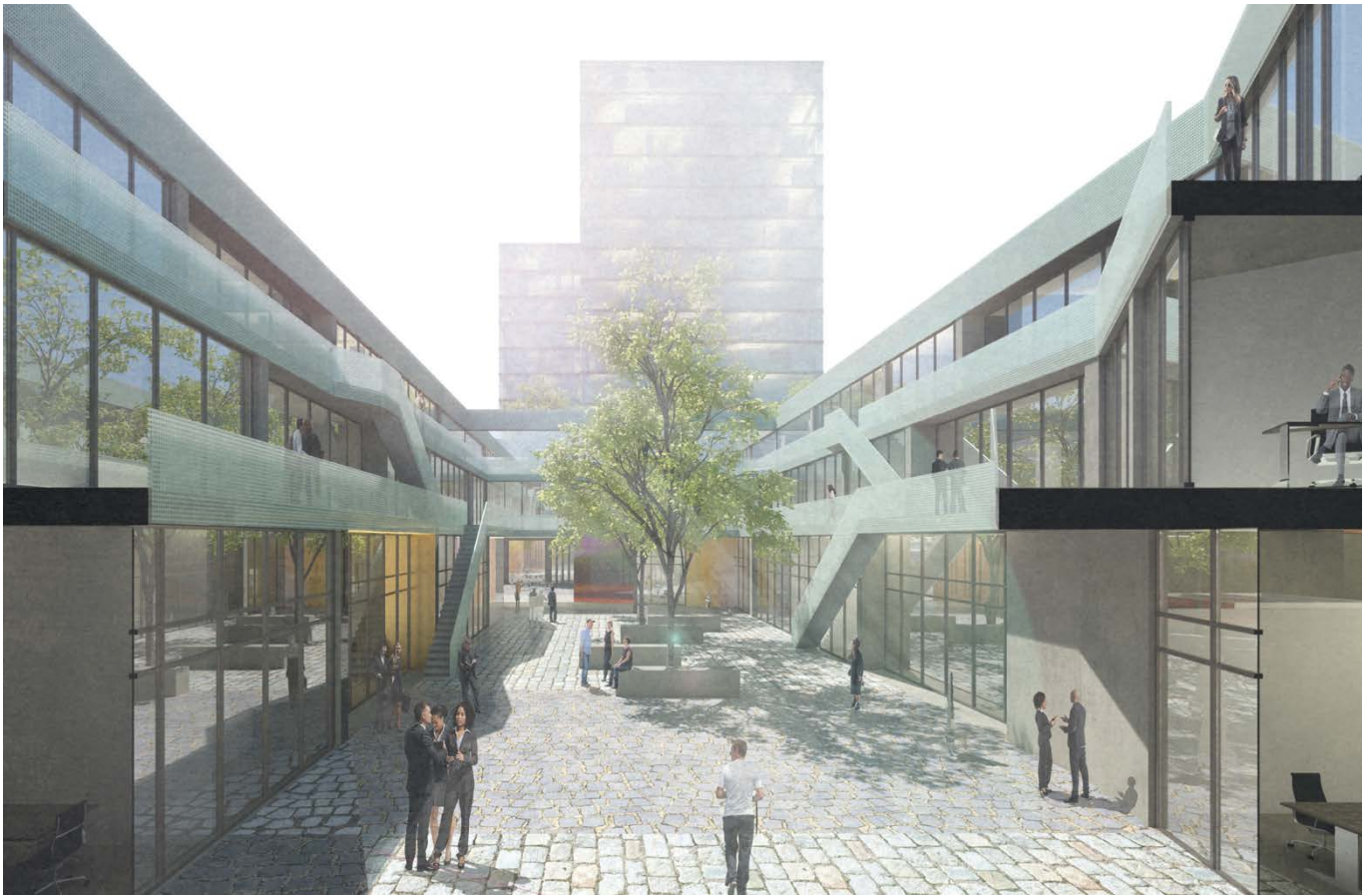
Perspektive Innenhof / courtyard perspective