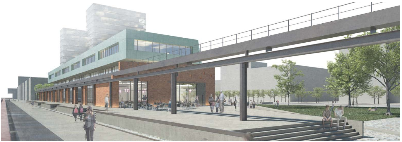
Außenperspektive / external perspective

In Verbindung mit dieser ausdrucksstarken, mit Kupferblech verkleideten Ergänzung und einem neuen 15-geschossigen Wohnturm entsteht ein städtebaulich prägnantes Ensemble, in dem neben Büro- und Gewerbeflächen auch eine Kindertagesstätte vorgesehen ist.