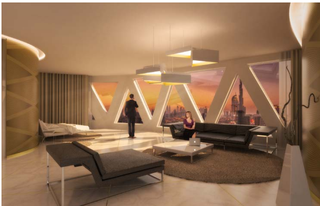
Innenperspektive / internal perspective

The Emirates Tower in Dubai should not only radiate pure luxury, but also express style and quality due to its location in a well-known fashion district – a world-class luxury hotel. The building is divided into three elements, which are connected on the lower three levels in the form of a podium. The centrally positioned tower provides a connection to the existing shopping mall, its recessed position on the property simultaneously forms an entrance and a spacious forecourt.