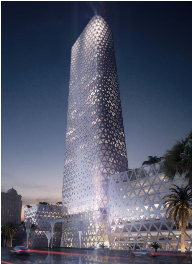
Nachtperspektive / night perspective