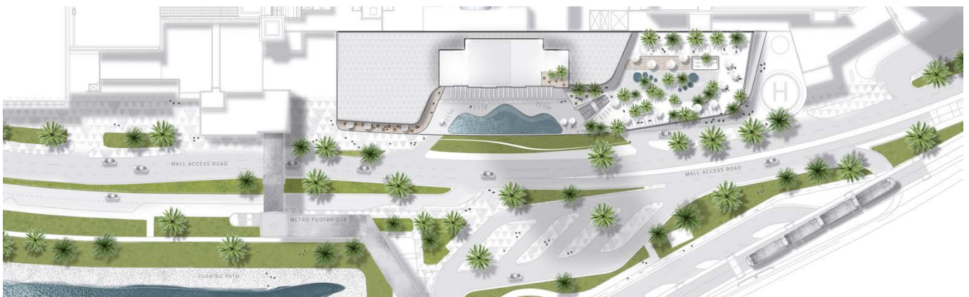
Lageplan / site plan