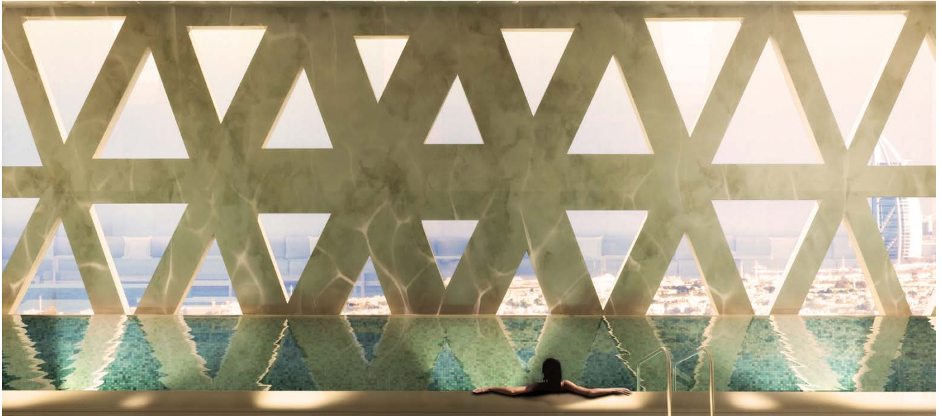
Pool im Spabereich / spa area pool

Im städtebaulichen Kontext wird der 160 Meter hohe Turm das herausragende Gebäude in der Skyline sein, wenn man sich der „Mall of the Emirates“ von der Sheikh Sayed Road aus nähert. Mit seiner weißen, aufwändig strukturierten Fassade strahlt der Turm wie ein Juwel und erzeugt eine unverwechselbare architektonische Identität, die den Ansprüchen der hochkarätigen Klientel entspricht und ein städtebauliches Aushängeschild für Dubais luxuriöse Hauptgeschäftsstraße darstellt.