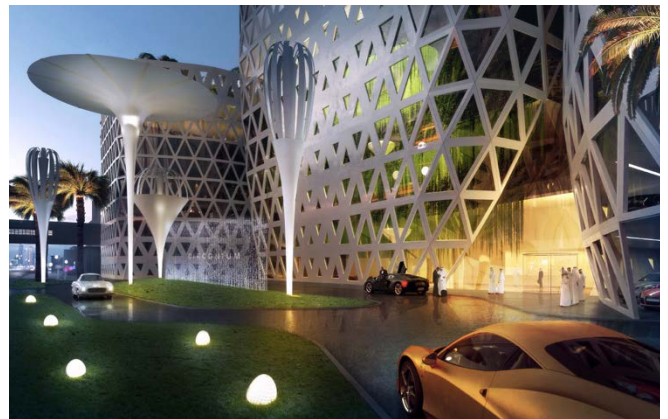
Eingangsperspektive / entrance perspective