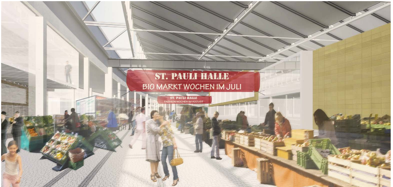
Innenperspektive Biomarkt / internal perspective organic market

Der großzügige Platz vor der Rindermarkthalle bleibt erhalten und wird durch eine verglaste Eingangshalle ergänzt, die sich zwischen zwei bestehenden Treppenhäustürmen befindet. Im Gegensatz zu Konzepten, die Abriss und Neubau vorschlagen, werden die überwältigende Qualität des Bestandsgebäudes, der ursprüngliche Charme und Charakter des Gebäudes in diesem Entwurf bewahrt.