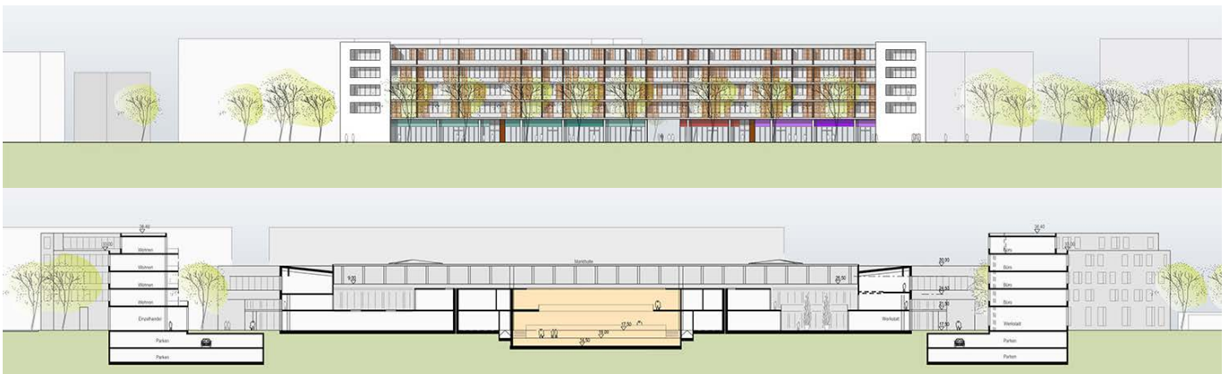
Schnitt und Ansicht / section and elevation