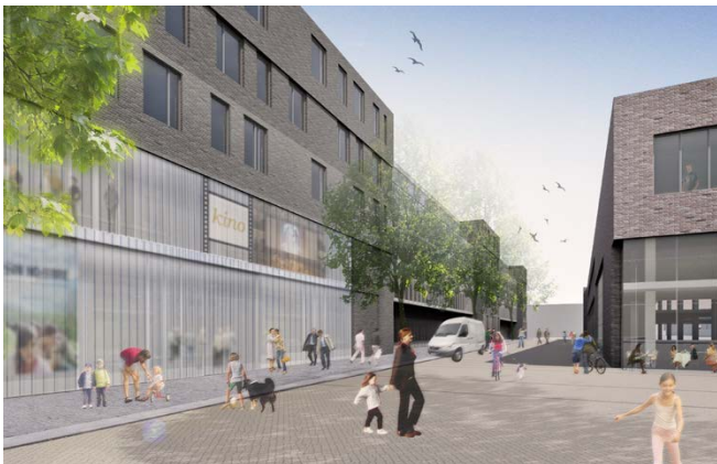
Außenperspektive / external perspective

A competition was held to find ideas for the conversion of the heritage-listed Rindermarkthalle dating from 1950/51 in Hamburg's St. Pauli district. Our design for a building complex with diverse cultural uses, office, residential and commercial spaces was awarded first prize. The new centre of the Rindermarkthalle is a music hall with 4,000 seats, whose foyer can be used as a flexible market hall in the daytime. Five five-storey new building blocks with apartments, offices for music and creative industries, and retail areas are planned on the east and west sides of the existing hall.