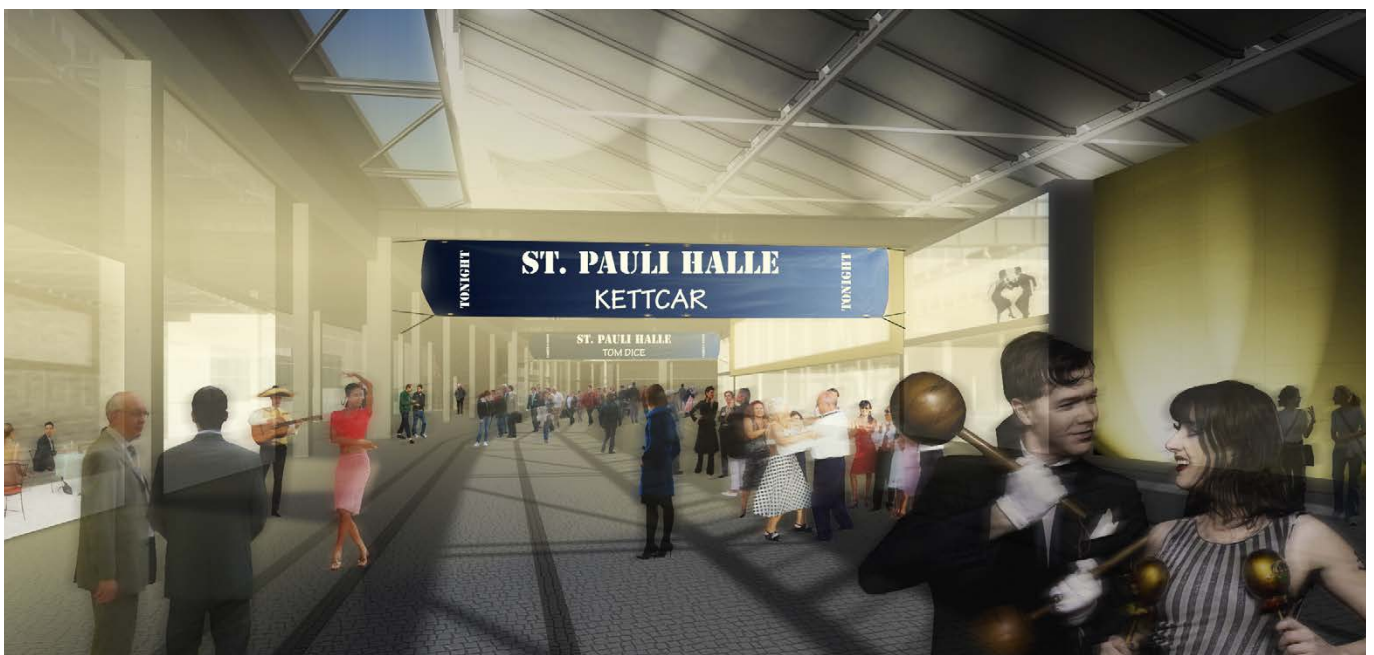
Innenperspektive Musikveranstaltung / internal perspective music event

The generous square in front of the Rindermarkthalle is maintained and complemented by a glazed entrance hall, which is located between two existing staircase towers. Contrary to concepts that propose demolition and the construction of a new building, this concept preserves the overwhelming quality of the existing building and its original charm and character.