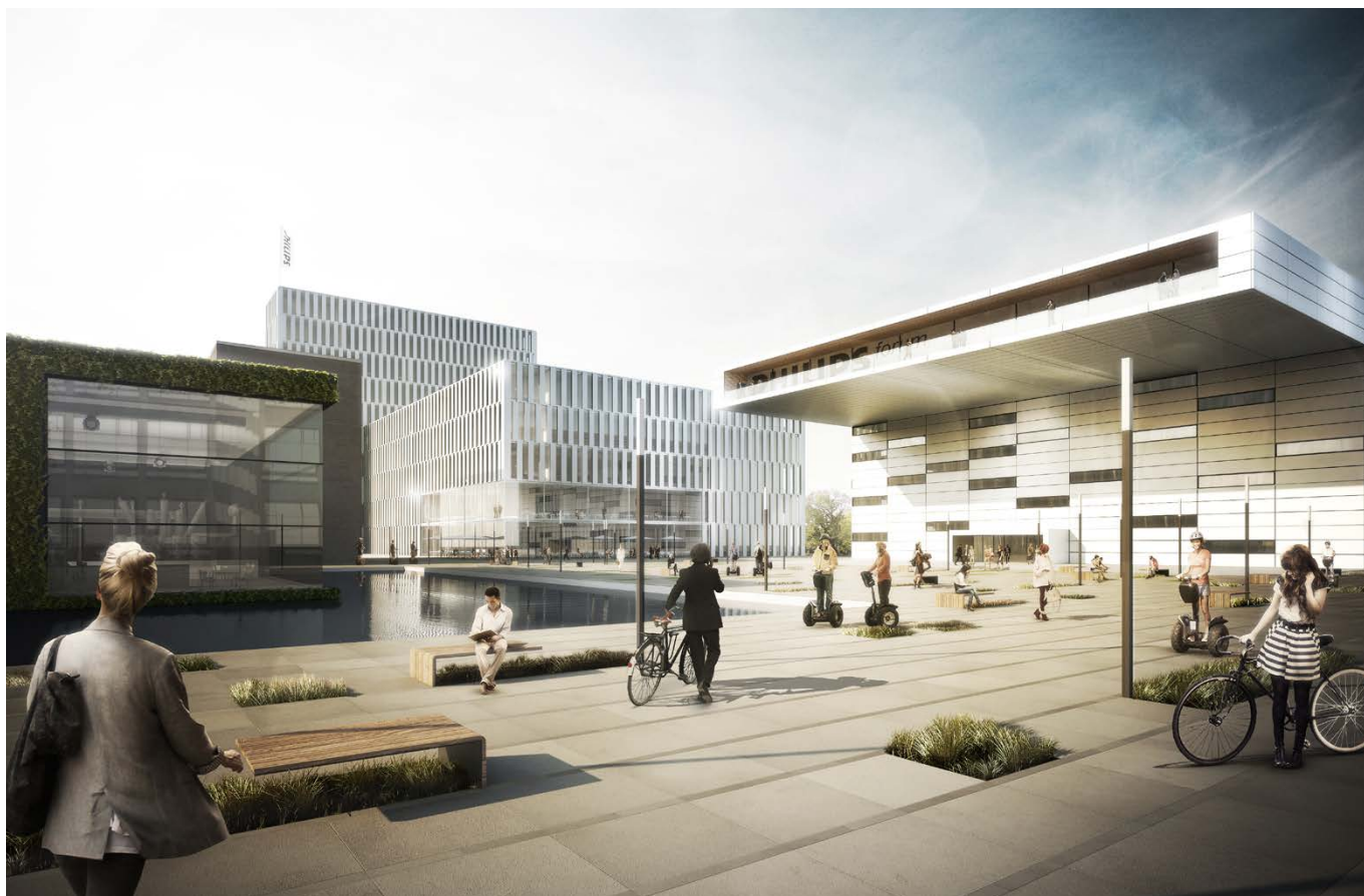
Blick auf den Philips Platz / view to the Philips square