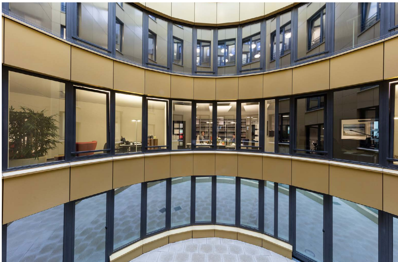
Innenhof / inner courtyard