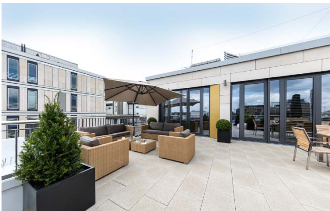
Dachterrasse / roof terrace