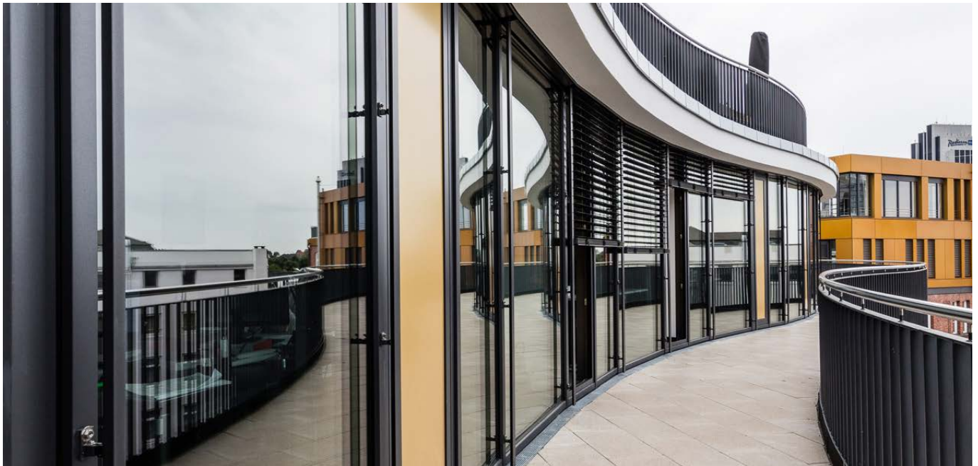
Dachgeschoss / top floor

Der Materialdialog aus hellem Jura-Kalkstein und farbigem Spezial-Eloxal verleiht dem Gebäude eine elegante Wirkung. Eine große Dachterrasse bietet den Nutzern großartige Ausblicke auf die Alster und über die Stadtlandschaft. Opera Offices Neo erfüllt die Anforderungen für die Silber-Zertifizierung der Deutschen Gesellschaft für Nachhaltiges Bauen (DGNB),