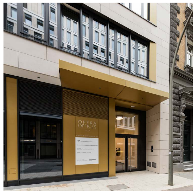
Haupteingang / main entrance