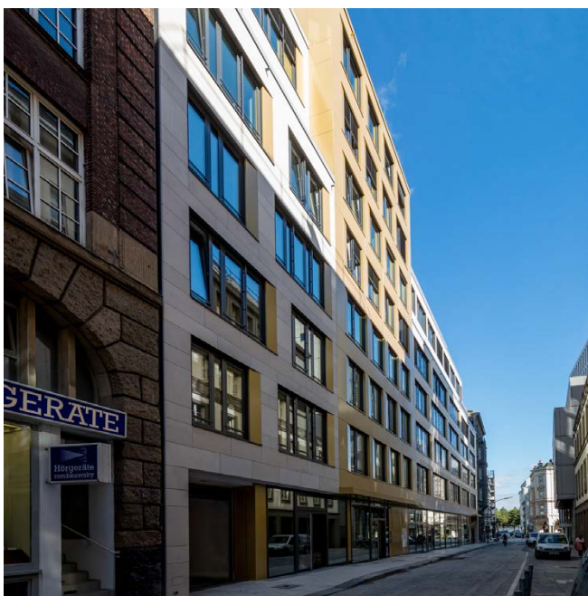
Straßenansicht / street elevation

The dialogue between the materials used, light Jurassic limestone and coloured special anodised aluminium "Eloxal", lends the building an elegant appearance. A large rooftop terrace affords magnificent views to the Alster and across the city's skyline. Opera Offices Neo meets the requirements of the silver certification by the German Sustainable Building Council (DGNB).