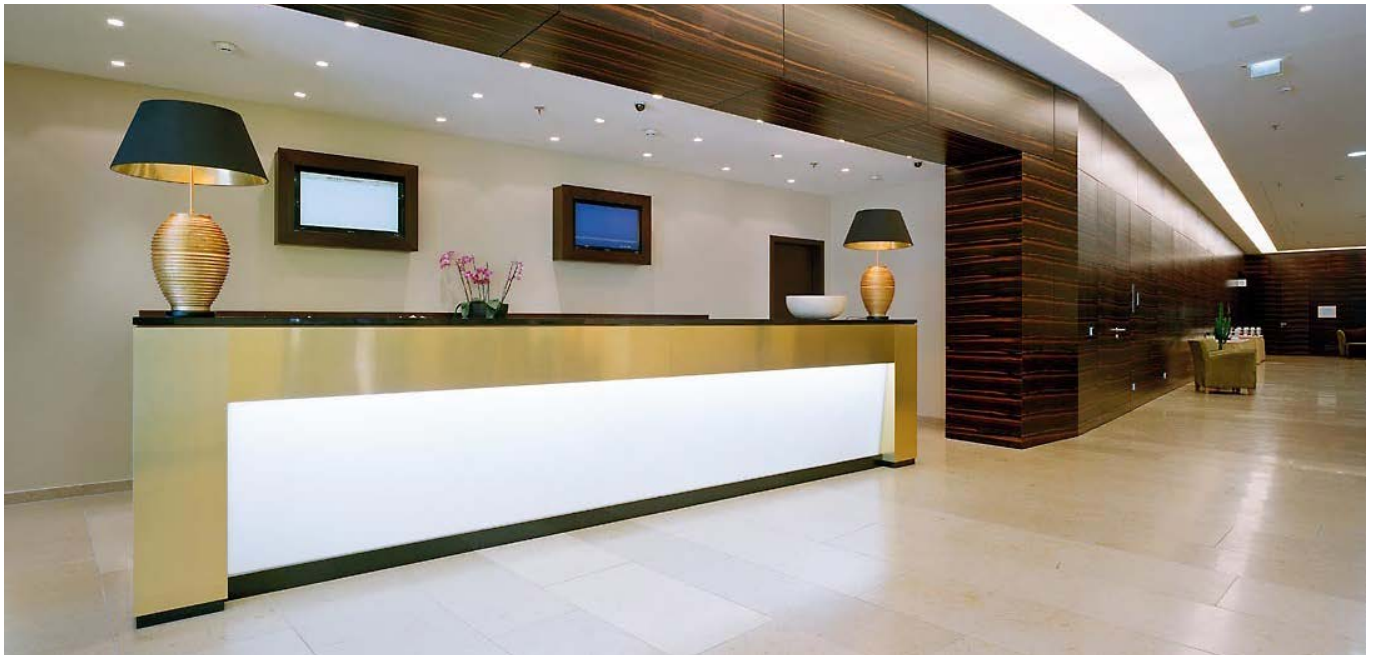
Rezeption / reception

Die Fassade ist durch geschosshohe, siebgedruckte Fensterelemente geprägt, die aus Gründen des Lärmschutzes als Kastenfenster ausgebildet sind, und so eine räumliche Tiefe erzeugen. Die Oberfläche der geschlossenen Elemente ist in einem schimmernden Rotton eloxiert. Die Anordnung verschiedener Fassadenelemente ergibt ein interessantes Erscheinungsbild mit einer differenzierten Tag- und Nachtwirkung.