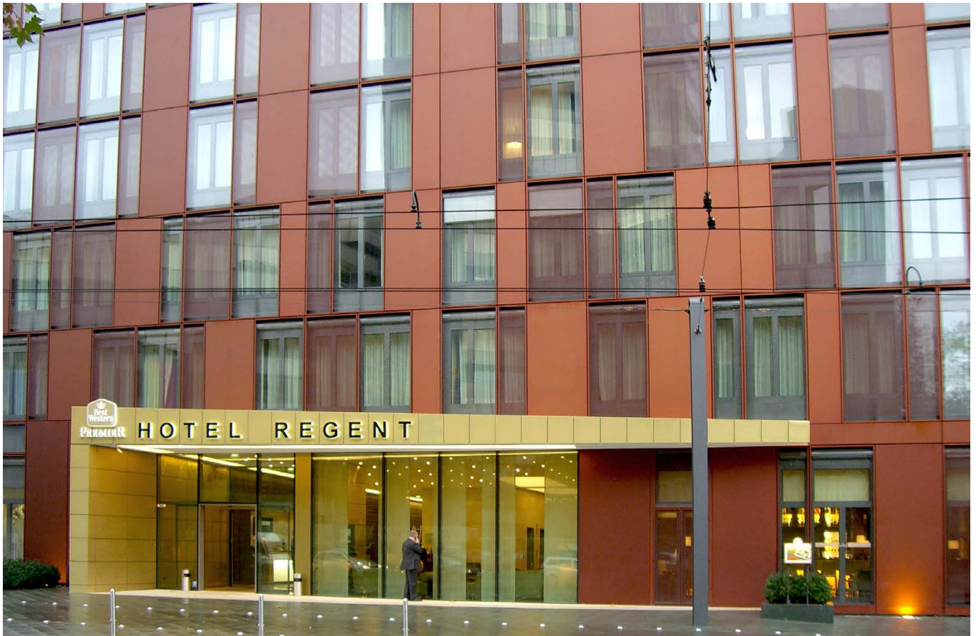
Haupeingang / main entrance