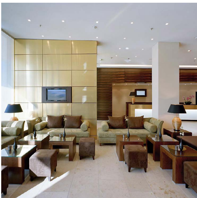
Lobby / lobby

The façade is characterised by storey-high, silk-screen printed window elements, which are for reasons of noise prevention designed as box-type windows, thus creating a three-dimensional effect. The surface of the closed elements is anodised in a shimmering shade of red. The arrangement of different façade elements generates an appearance whose effect varies during the day and at night.