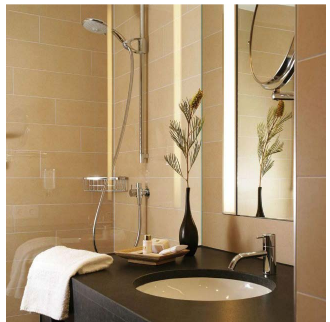
Detail Badezimmer / bathroom detail