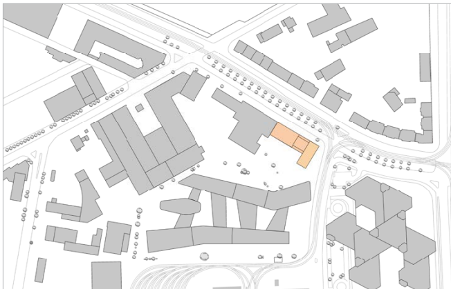
Lageplan / site plan

The project comprises the construction of the new Hotel Regent located at the corner of Scheidtweilerstraße / Melatengürtel as well as a training centre for the DKV staff. The building has a close spatial and design relationship to the neighbouring new DKV headquarters. The 4-star hotel provides 178 rooms on the upper levels, while the ground floor accommodates four conference rooms with a usable floor space of up to 320 square metres each. All necessary service facilities and a fitness area are located on the basement levels.